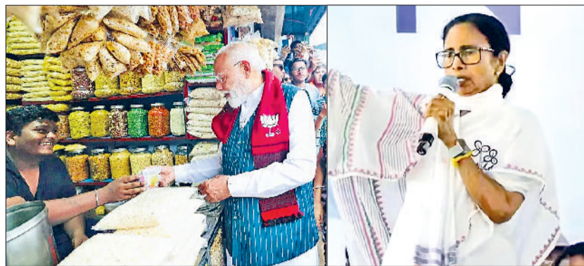
दुकानदार को मलाल : पीएम मोदी का नहीं ले पाया आँटोग्राफ

तमिलनाडु और पश्चिम बंगाल में विधानसभा चुनाव के लिए 23 अप्रैल को मतदान होना है। अब राजनीतिक दलों ने प्रचार अभियान और तेज कर दिया। बंगाल में मछली, मटन के बाद अब झालमुरी चुनावी चर्चा का विषय बन गई है। बंगाल में प्रधानमंत्री मोदी के झालमुरी खरीदने के वाक्य पर सियासत तेज हो गई है। मुख्यमंत्री ममता बनर्जी ने इसे नाटक बताया और कहा कि यह पूरा घटनाक्रम पहले से तय था।