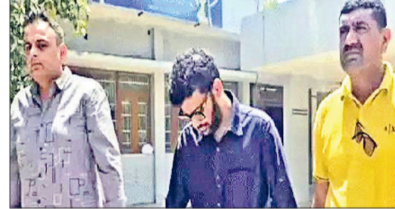
गुरुग्राम। नकली दवा बनाने का आरोपी पुलिस गिरफ्त में।

आप वजन घटाने के लिए या डायबिटीज पर कंट्रोल करने के लिए दवा ले रहे हैं, लेकिन असर नहीं हो रहा तो एक बार अपना इंजेक्शन चेक करवा लीजिये। गुरुग्राम की एक सोसाइटी में स्वास्थ्य विभाग की टीम ने छापा मारकर नकली इंजेक्शन बनाने की एक फैक्ट्री का भंडाफोड़ किया है। आरोपी चीन से रॉ ड्रग्स मंगाकर