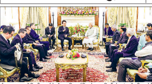
हैदराबाद हाउस में द्विपक्षीय बैठक के दौरान दक्षिण कोरिया के राष्ट्रपति ली जे-युंग और पीएम मोदी